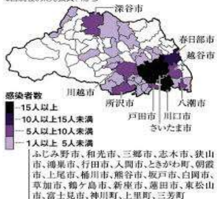
新型コロナウイルス感染者の市町村別分布 3日現在。県発表資料から

話は少し変わりますが、「JINS」というメガネフランチャイズチェーンをご存知の方も多いと思いますが、本文を書いています（スタッフ：I）が、先日メガネを新調したく、新しいものを作りに行った時の事。測定から仕上がりまで20分で出来上がりました。20分ですよ！今まで人の手で目で計測していた視力も機械に顎を載せるだけのものの1分で基本の視力の計測が完了。そして、 今装着のコンタクトの度数へのアドバイス 、最終調整もあらかじめその人にあった度数を準備してからの調整。すべてがコンスタントにスピーディに。他のメガネサロンでもメガネを作りますが、JINS程、早いところは初めてでした。