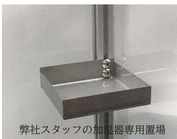
弊社スタッフの加湿器専用置場

会社のデスク回りや、食堂などにも。様々なサイズやデザインをミリ単位で制作が可能です。また、このアルミフレーム製品には後付けで受け皿などをつけることも可能で（受け皿は別途制作いたします）、用途に応じた自分だけのカスタマイズが出来ます。