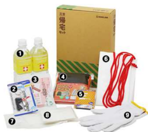
食物アレルギー特定原材料等 28品目と貝類 不使用

A4ファイルサイズパッケージに納まり、個人で保管しやすく、もしものときもすぐそばに。ほかにも「災害ヘルメット」「災害トイレ」「災害備蓄セット」などのご用意があります。